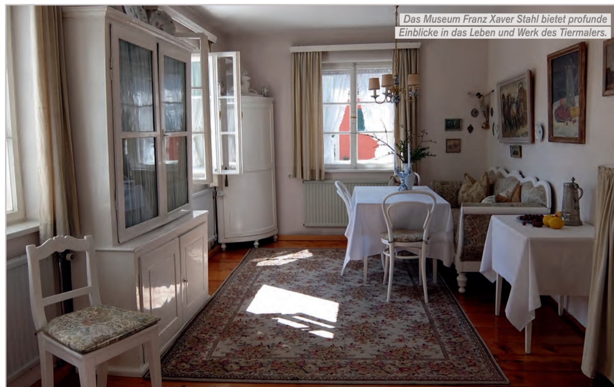
Das Museum Franz Xaver Stahl bietet profunde Einblicke in das Leben und Werk des Tiermalers.