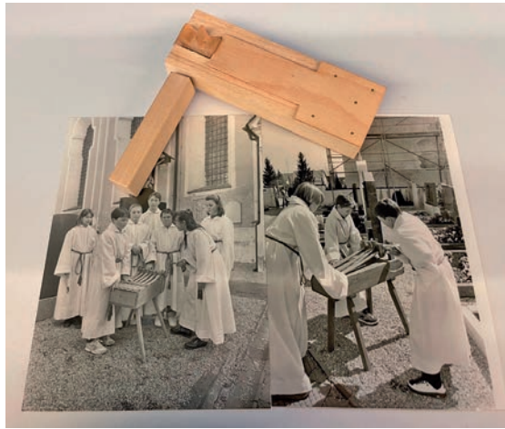
Beim Workshop Anfang April bauen die Teilnehmer Oster-ratschen selbst zusammen.

Das Museum Erding in der Prielmayerstraße 1 bietet am Montag, 3. April, von 14 bis 17 Uhr einen Osterbastelworkshop für Kinder ab acht Jahren an. Weil nach einem katholischen Osterbrauch von Gründonnerstag bis zur Osternacht die krachmachenden Ratschen die verstummten Kirchenglocken ersetzen, hilft das Museum, altes Brauchtum neu zu entdecken. Unter der fachmännischen Anleitung von Michael Käsbauer und Helmut Bungart werden die Ratschen aus Holz