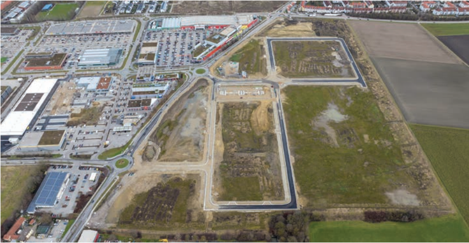
Die Erweiterung des Gewerbegebiets Erding-West nimmt Gestalt an. Nähere Infos finden sich im aktuellen Leistungsbericht.