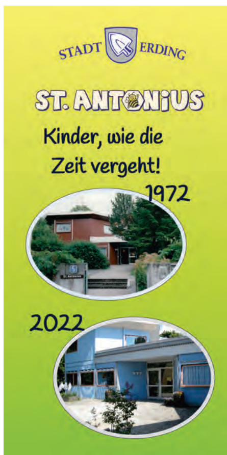
Der Kindergarten bietet ein großes Programm.