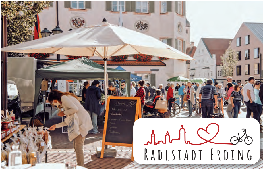
Die Marktschranne bildet die passende Kulisse für die Auftaktveranstaltung zum „Stadtradeln“.