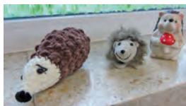
Igel sind das Maskottchen des Kindergartens.

Die Erzieherinnen und Kinderpflegerinnen verstehen sich als einfühlsame