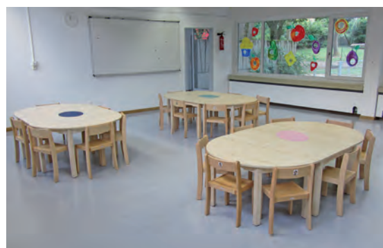
Der Kindergarten – hier der Speiseraum – ist in den ehemaligen Schulräumen untergebracht.