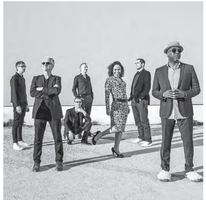
... DePhazz zu den erfolgreichsten deutschen Musikexporten.