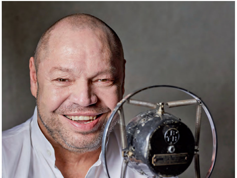
Thomas Quasthoff zählt zu den bekanntesten klassischen Sängern ...

das Romeo Franz Ensemble im Airbräu am Flughafen (Eintritt frei) sein Gastspiel, inspiriert vom „Quintette du Hot Club de France“ und Django Reinhardt aus dem Paris der 1930er Jahre. Das übrige Programm findet in der Kreismusikschule statt: Um 14.30 Uhr gibt die Nuejazz für Kids Combo aus Nürnberg (Eintritt fünf Euro, Kinder frei) das „Jazz für Kinder“-Konzert, ein Muss aller Jazz Tage. Eigentlich zum Beethoven-Jahr 2020 geplant, machen die Jazz Tage um 19.30 Uhr ein besonderes Kon-