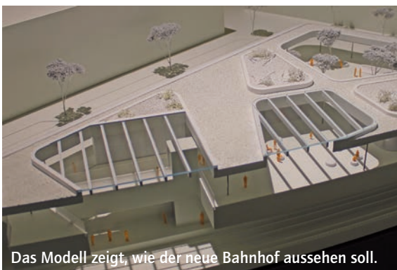
Das Modell zeigt, wie der neue Bahnhof aussehen soll.