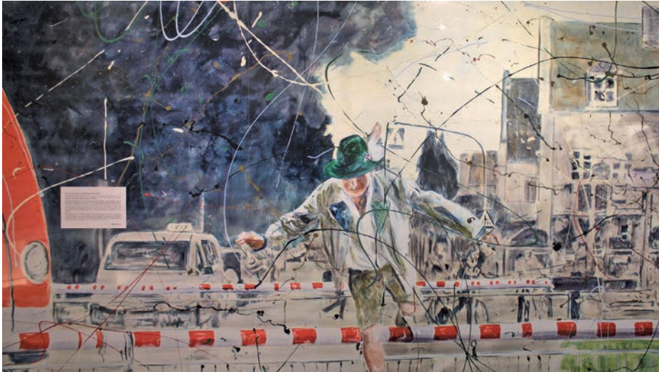
Zeichen des Protests: Der die Schranken überspringende Erdinger forderte vor Ort, den Bahnübergang in der Haager Straße zu untertunneln. Das Originaltransparent ist Teil der Ausstellung, das Motiv stammt von Harry Seeholzer.